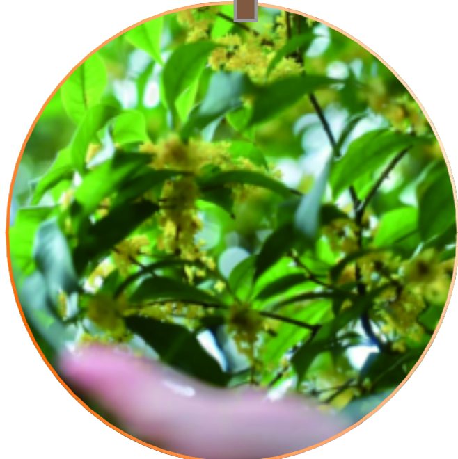
把秋天装进镜子里,便拥有了两份秋天。