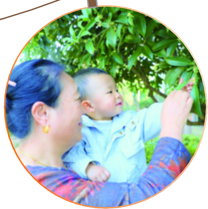
一阵秋风起,吸进鼻子的,是大把大把的香甜。