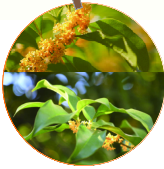
阳光下,桂花闪闪发光,如秋天赠予的礼物。