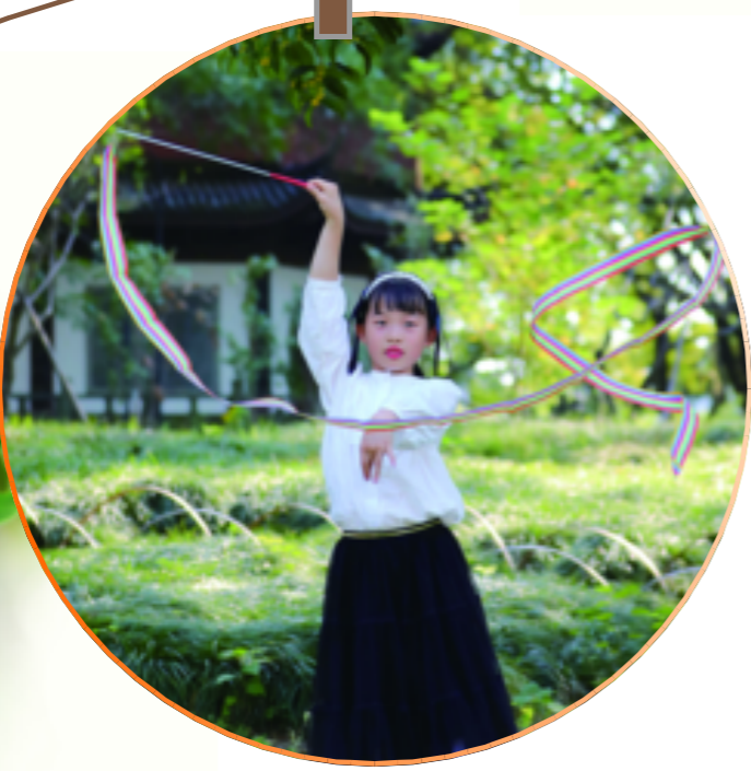
可爱的小姑娘在桂花树下翩翩起舞。