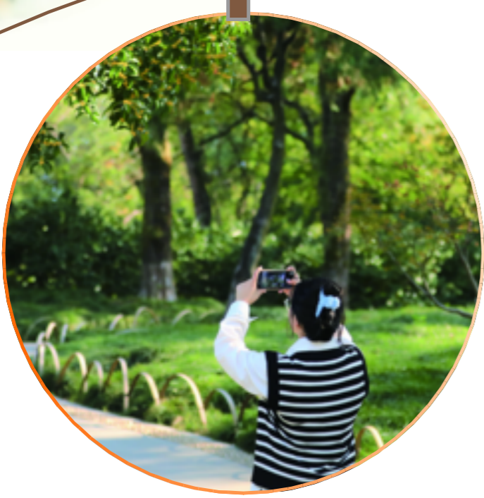
市民拿起手机,桂花味的秋天就定格在镜头里。